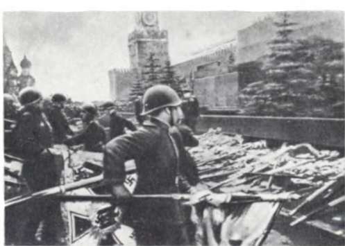
Советские воины-победители бросают знамена поверженной гитлеровской армии к подножию Мавзолея В. И. Ленина. Москва, 24 июня 1945 г.