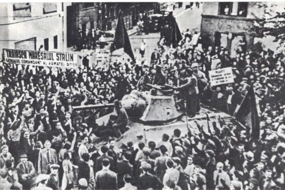
Встреча советских войск в Бухаресте. Август 1944 г.