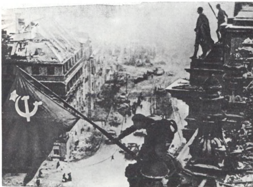
Знамя Победы над рейхстагом (30 апреля 1945 г.)