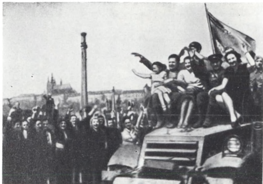
Население Праги приветствует советских воинов. 9 мая 1945 г.