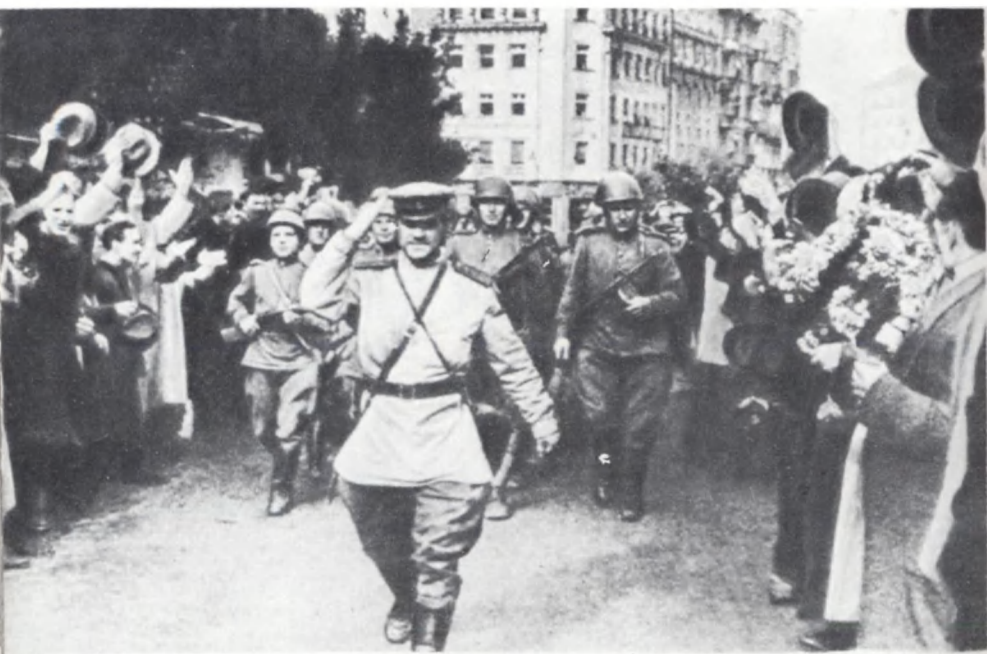
Жители Белграда приветствуют воинов Советской Армии. Октябрь 1944 г.