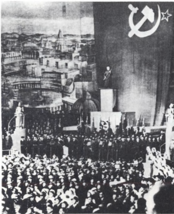
Митинг, посвященный открытию выставки «25 лет СССР и Красной Армии». Лондон, 21 февраля 1943 г.