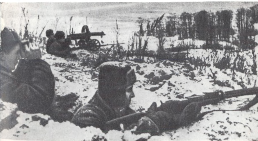
На переднем крае обороны столицы. Декабрь 1941 г.