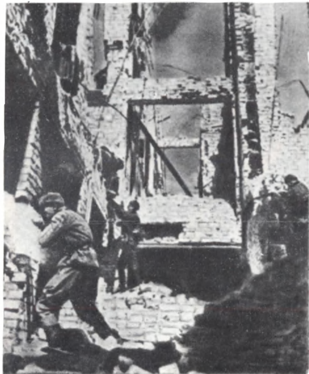
Битва на Курской дуге. Наступление советских войск. Июль 1943 г.