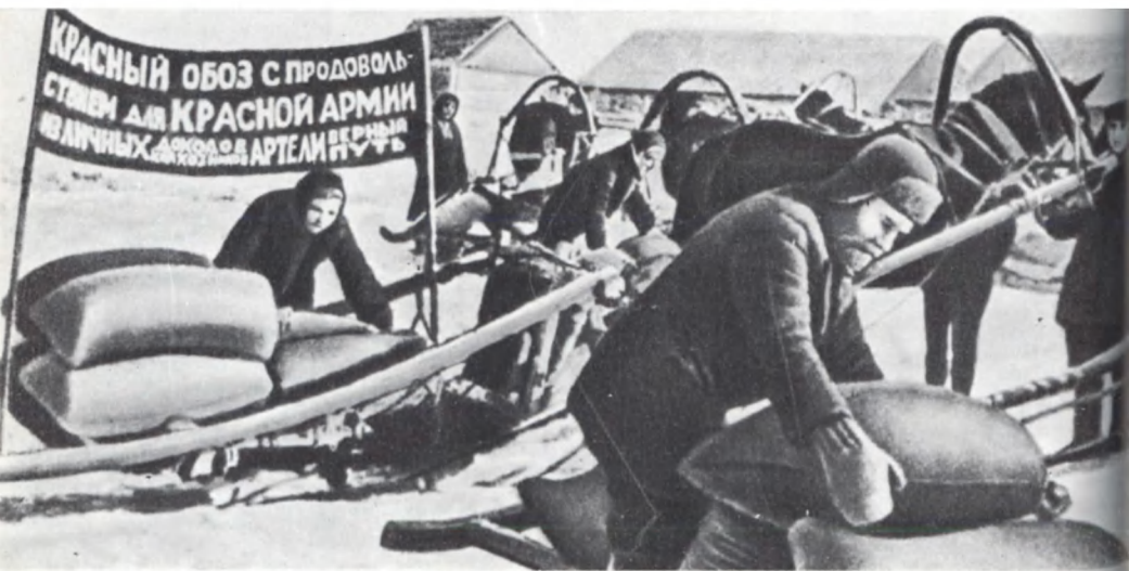
Колхозники — фронту. Январь 1943 г.