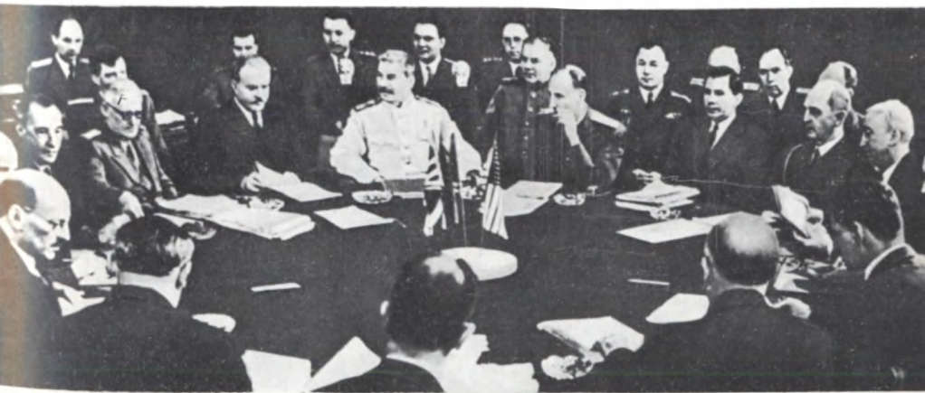
На Берлинской конференции. Июль 1945 г.