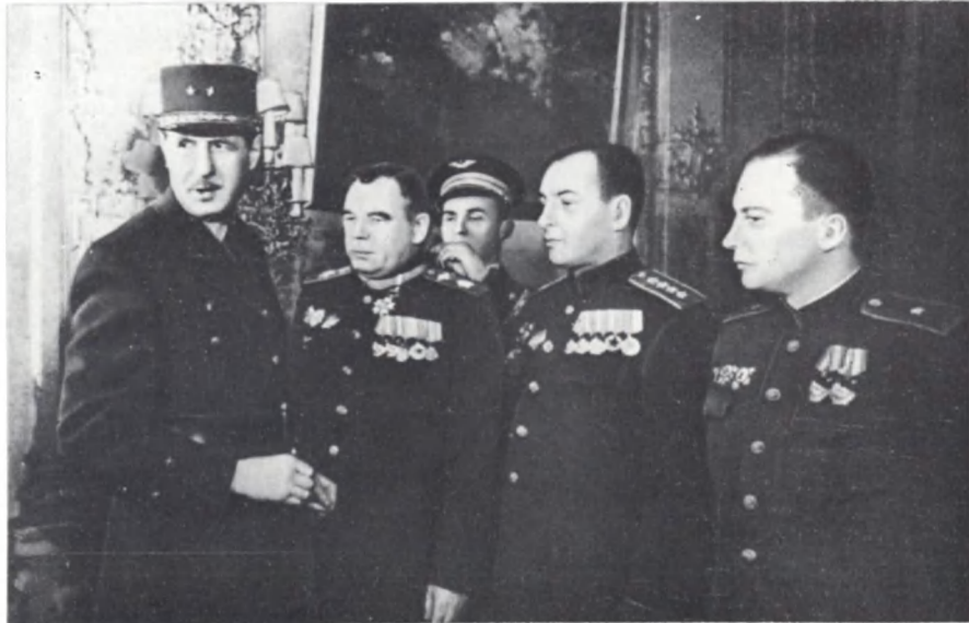
Генерал Ш. де Голль вручает ордена маршалу авиации Ф. Я. Фалалееву и генералам А. И. Антонову, Н. В. Славину. Декабрь 1944г