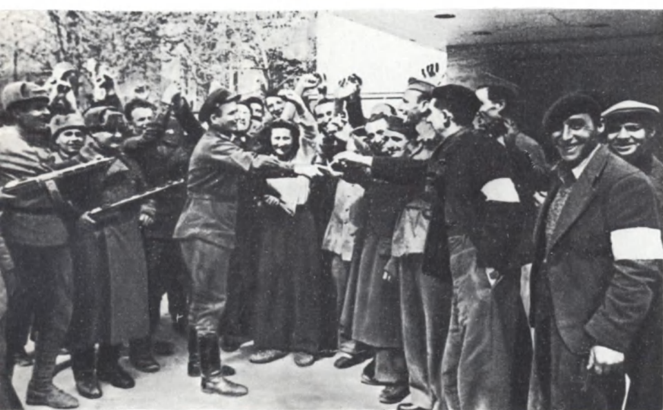
Французские рабочие, угнанные гитлеровцами для работы на заводах Вены, приветствуют своих освободителей — воинов Советской Армии. Апрель 1945 г.