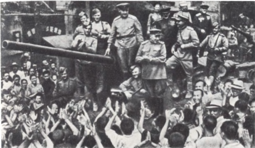
В освобожденном городе Дальнем население приветствует Советскую Армию. Август 1945 г.