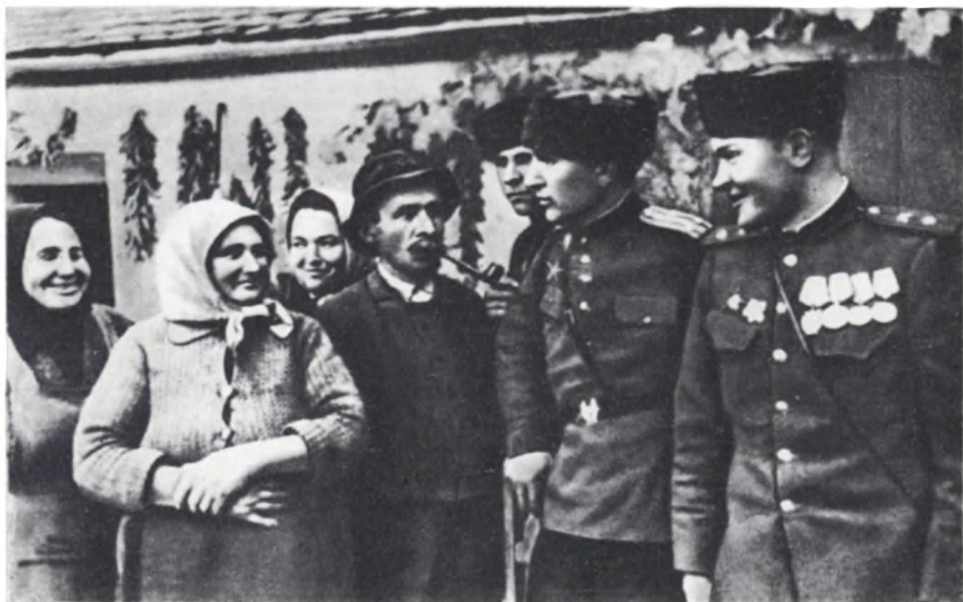
Встреча советских кавалеристов с венгерскими крестьянами. Октябрь 1944 г.