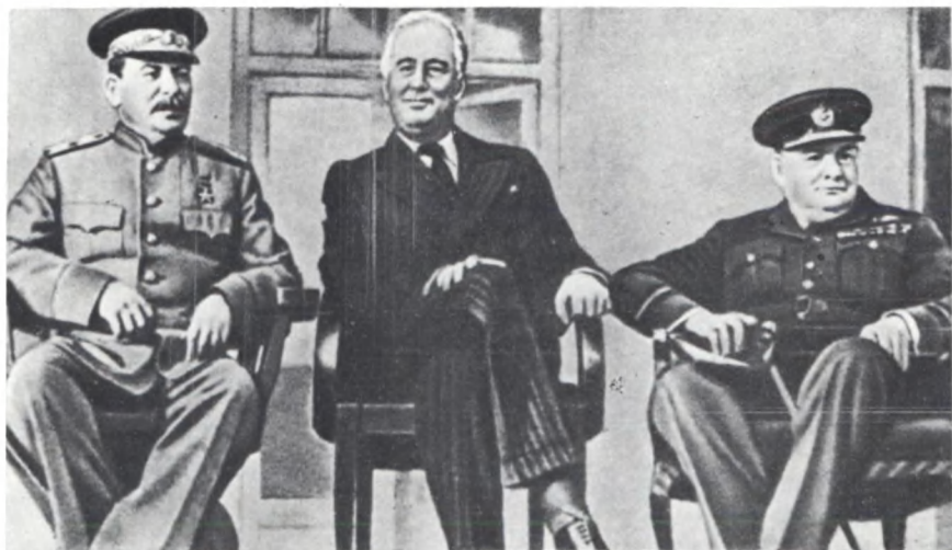
На Тегеранской конференции. Ноябрь 1943 г.