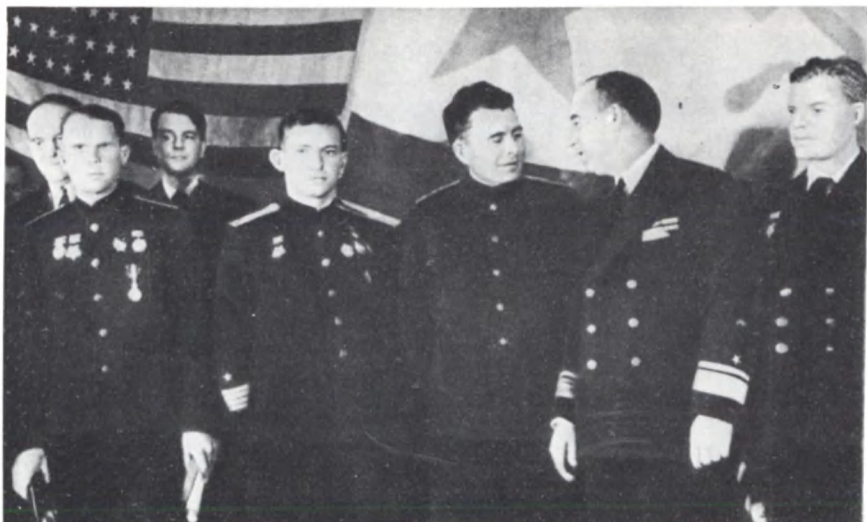
Группа советских офицеров-морьяков после вручения им американских наград. 1943 г.