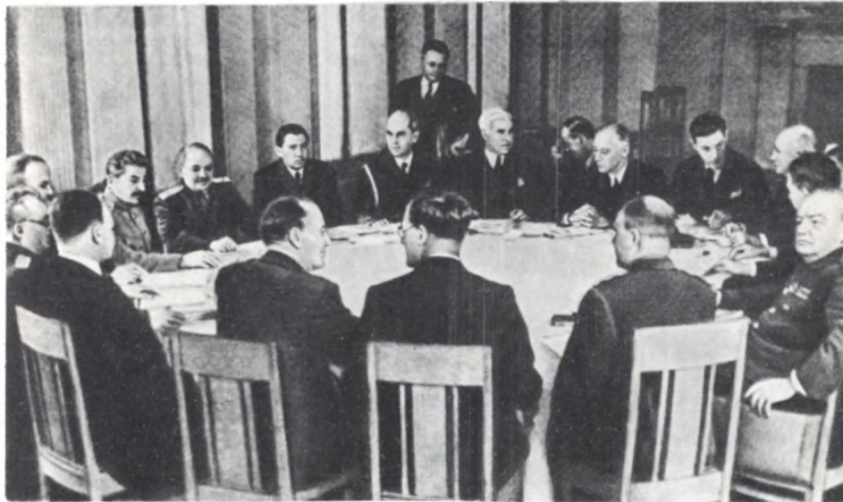
Крымская конференция. Февраль 1945 г.