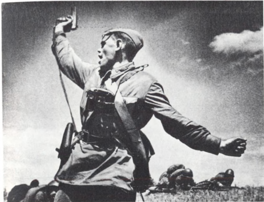
В бой за Родину