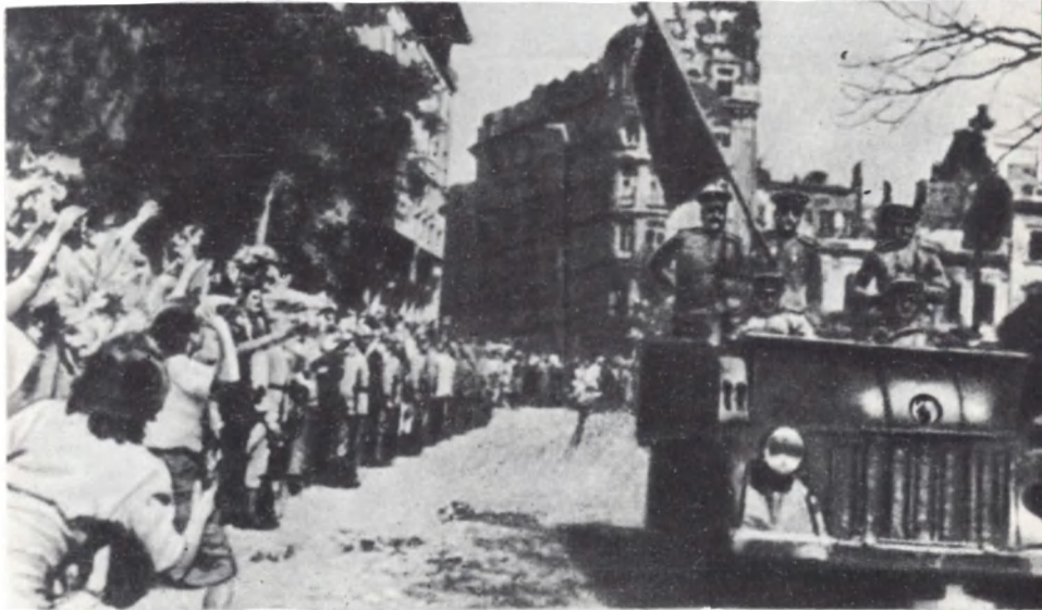
Торжественная встреча советских воинов в Софии. Сентябрь 1944 г.

Жители предместья Варшавы — Праги приветствуют своих освободителей — воинов Советской Армии. Сентябрь 1944 г.