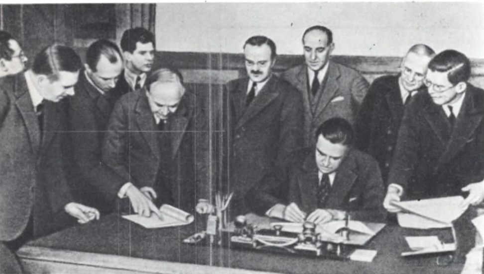
Подписание представителями СССР, Великобритании и США документов Московской конференции по вопросу о взаимных поставках. Октябрь 1941 г.