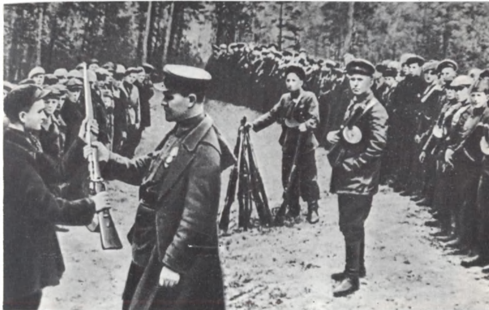
Вручение оружия молодым партизанам. 1943 г.

Десятки тысяч москвичей и жителей Подмосковья участвовали в строительстве оборонительных рубежей на подступах к столице. 1941 г.